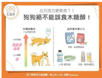
攝取太多木糖醇會導致死亡