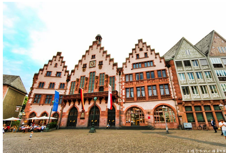
羅馬丘廣場(羅馬廣場)